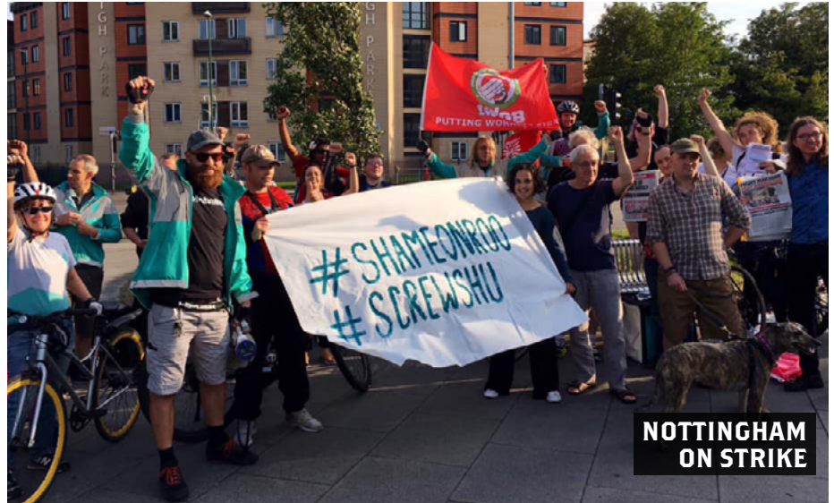
NOTTINGHAM ON STRIKE

This was the second closure of the site within a week. Responding to the booking system changes riders shut it down on the 7th July as well.